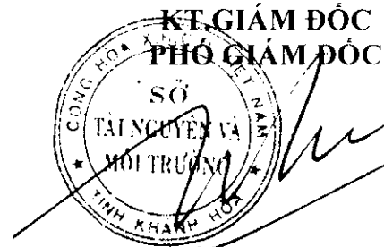
Trần Xuân Tây